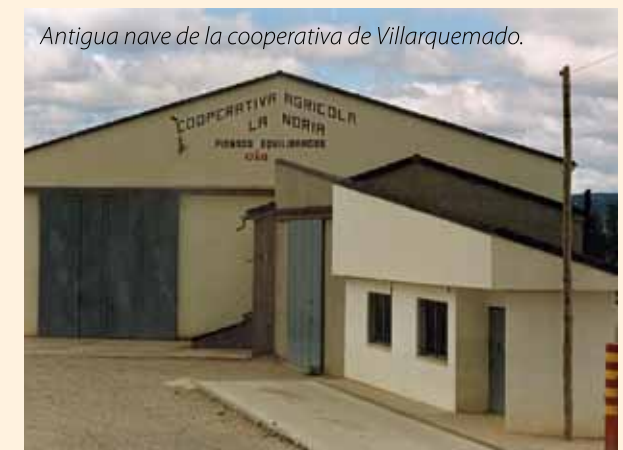
Antigua nave de la cooperativa de Villarquemado.

Pero en el año 2002, la nave se derrumbó, dejando al descubierto la cosecha de aquella campaña. Por suerte, acababan de construir una nueva nave de unos 600 metros, la más pequeña de las dos que hay en la actualidad. Cuando limpiaron todos los escombros del viejo almacén, sobre el mismo solar, construyeron otra mayor, de algo menos de 1000 metros «entonces ya estaba yo