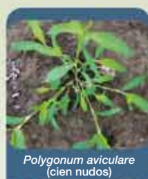
Polygonum aviculare (cien nudos)