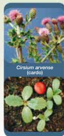
Cirsium arvense (cardo)