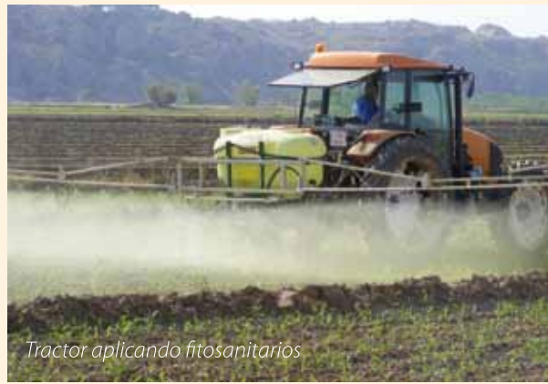
Tractor aplicando fitosanitarios

En 2016, los equipos de aplicación de fitosanitarios habrán tenido que ser inspeccionados al menos una vez, como recoge el Real Decreto que se publicó en el Boletín Oficial del Estado del 9 de diciembre de 2011, de inspecciones periódicas de los equipos de aplicación de productos fitosanitarios. A partir de ahora las Comunidades Autónomas tendrán que desarrollar dicho decreto, aunque ya están elaborando el censo de estos equipos.