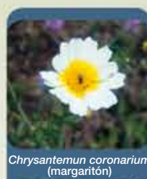
Chrysanthemum coronarium (margaritón)