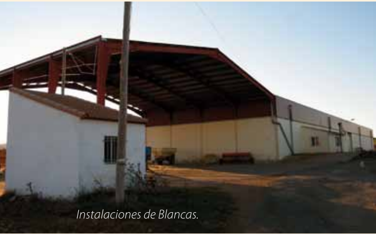
Instalaciones de Blancas.