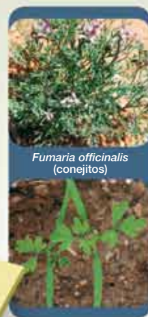
Fumaria officinalis (conejos)