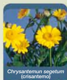
Chrysanthemum segetum (crisantemo)

Controla más de 60 malas hierbas de hoja ancha incluso las difíciles