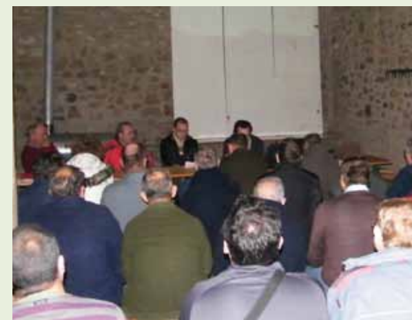
Asamblea celebrada en la sección Sierras del Pobo

Los factores que influyeron para obtener estos buenos resultados en la campaña pasada fueron la obtención de una buena cosecha de cereal (155.000 Tm.); los márgenes brutos en la compra de cereal a terceros no socios (5.000 Tm.), el ligero repunte en la venta de fertilizantes y la facturación de la prestación de servicios por seguimiento de la medida de la Producción