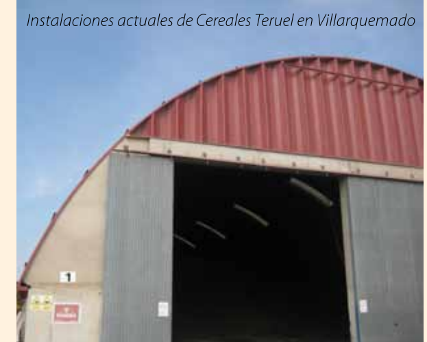
Instalaciones actuales de Cereales Teruel en Villarquemado