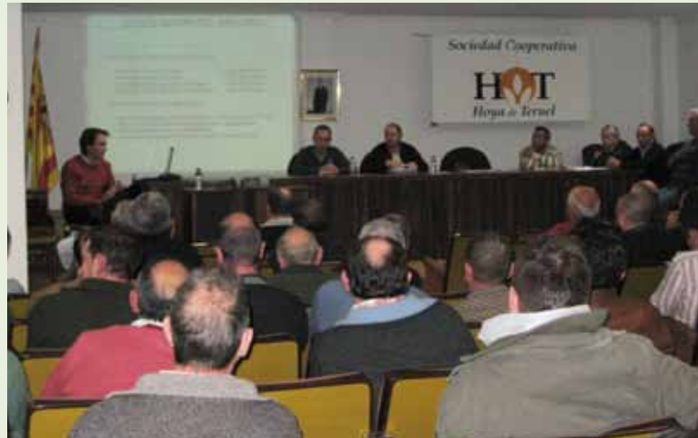
Este año fue el primero en el que se celebró la asamblea de CETER en la sección de La Hoya