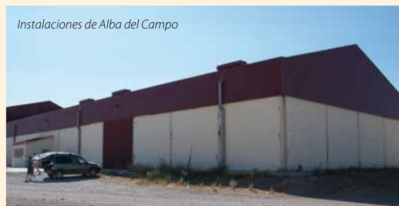
Instalaciones de Alba del Campo

Actualmente, la sub-sección de Alba cuenta con las dos naves, su báscula, una sembradora de pipas, una sulfatadora, una abonadora y el poste de gasoil. Todas las necesidades de maquinaria e infraestructura están más que cubiertas.