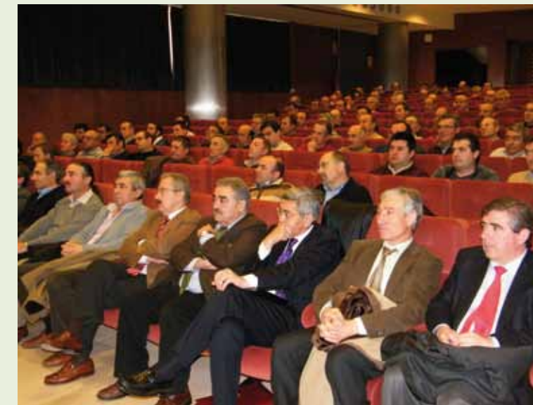
Invitados asistentes a la Asamblea General celebrada en Teruel el día 19.