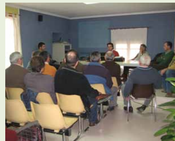
Asamblea General Ordinaria celebrada en la sección de Bañón

El balance económico hasta junio de 2011, que es cuando se cierra el ejercicio, arrojó un beneficio de 197.700 € después de impuestos. Con un exceso de liquidez de dos millones de euros y un patrimonio de 11.582.940 € se puede decir que la situación financiera de la cooperativa es hoy por hoy muy buena. El director de CETER explicó cómo se iban a distribuir los beneficios, entre los fondos de reserva obligatorios, los voluntarios, los de promoción cooperativa, etc.