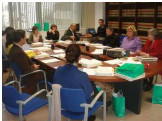
Reunión del grupo de trabajo de cultivos extensivos.

poniendo al día a todos los técnicos de todas las novedades en materia fitosanitaria y de tratamientos integrados. ■