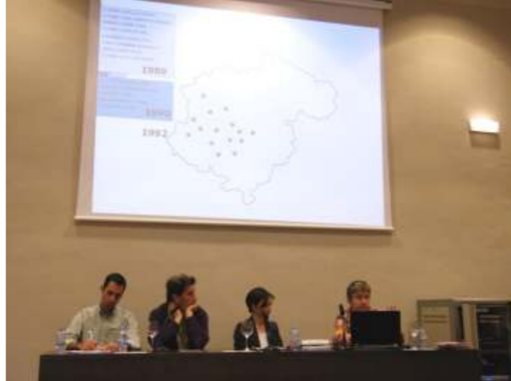
Universidad de Zaragoza.

Posteriormente, intervino un miembro del Grupo Adocrin, que comenzó su andadura dedicándose a la restauración rural, siendo fieles a la estética tradicional. Dieron un paso más y también recuperaron una especie autóctona, la cabra moncaína. Al igual que Ecomonegros, Adocrin quiso poner en valor estos productos y otros típicos del Moncayo y adquirieron La Corza Blanca, el primer Restaurante de la Biosfera de la Península Ibérica, una acreditación que distingue aquellos establecimientos a nivel mundial que cumplen estrictos requisitos de comportamiento medioambiental y cultural.