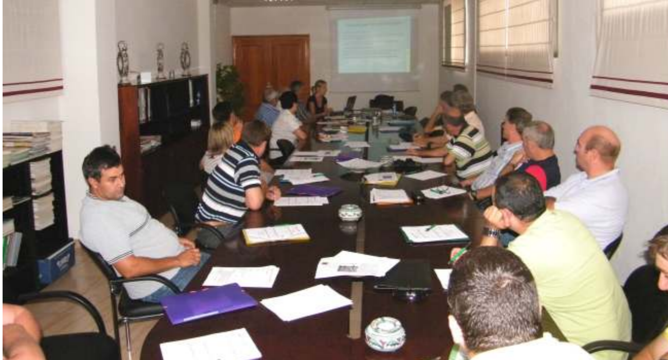
Curso para la obtención del carné de manipulador de productos fitosanitarios impartido por los técnicos de CETER.