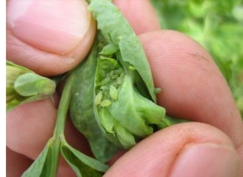
El guisante es uno de los cultivos que más tratamientos específicos necesitan.

La inmensa mayoría de nuestros socios disponen del carné de manipulador de productos fitosanitarios. Este carné es obligatorio para poder manipular cualquier producto fitosanitario y su no disponibilidad puede incluso traer sanciones económicas. Por ello, la inmensa mayoría de agricultores ha corrido para tenerlo. Damos fe de ello pues nuestro departamento técnico ha organizado, organiza y posiblemente seguirá, no solo organizando, sino también impartiendo los cursos necesarios para la obtención de dicho carné. Por esta experiencia nos creemos autorizados para poder escribir este artículo, en el que no vamos a hablar de agronomía sino de responsabilidades de uso de estos productos, tal y como ocurre en estos cursos en los que apenas se habla de cómo se llevan a cabo los tratamientos, como actúan los productos o su eficacia en el control de plagas. En estos cursos se habla sobre todo de preven-