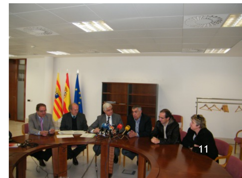
Rueda de prensa de la aprobación de la ayuda.