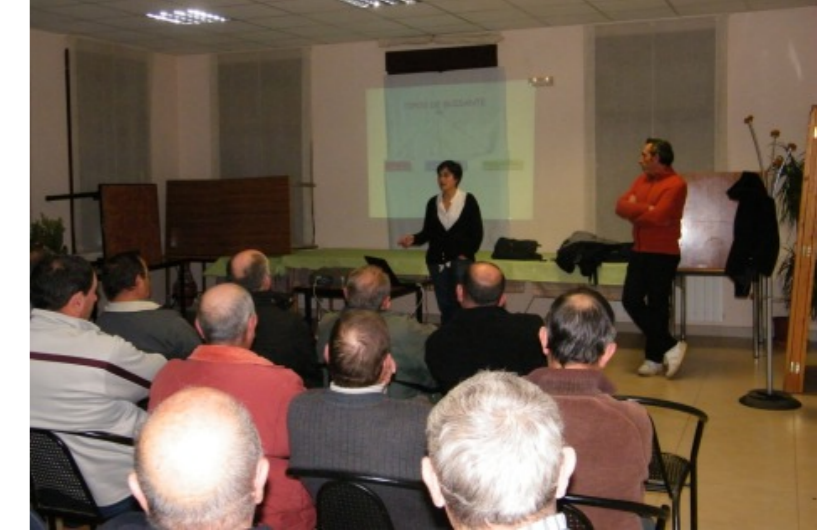
Charla técnica sobre el cultivo del guisante en Perales del Alfambra.

eficaz. Si es demasiado tarde y el gorgojo ha llegado al almacén también existen productos para eliminarlos como el metil pirimifos .