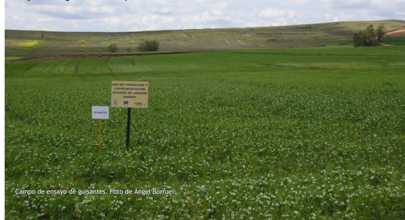
Campo de ensayo de guisantes.

Lo idóneo es sembrar los guisantes en otoño, ya que estos serán más resistentes al frío. Hay que elegir suelos francos, que drenen bien, porque el encharcamiento del suelo perjudica al guisante. El laboreo ha de ser profundo y la siembra precisa, en cantidad y profundidad, —tanto por el coste como para conseguir una nascencia homogénea— y es importante ser generosos con la dosis (200-220 kilos por hectárea), para disminuir la aparición de malas hierbas. Después de sembrar, se recomienda dar un pase de rulo, ya