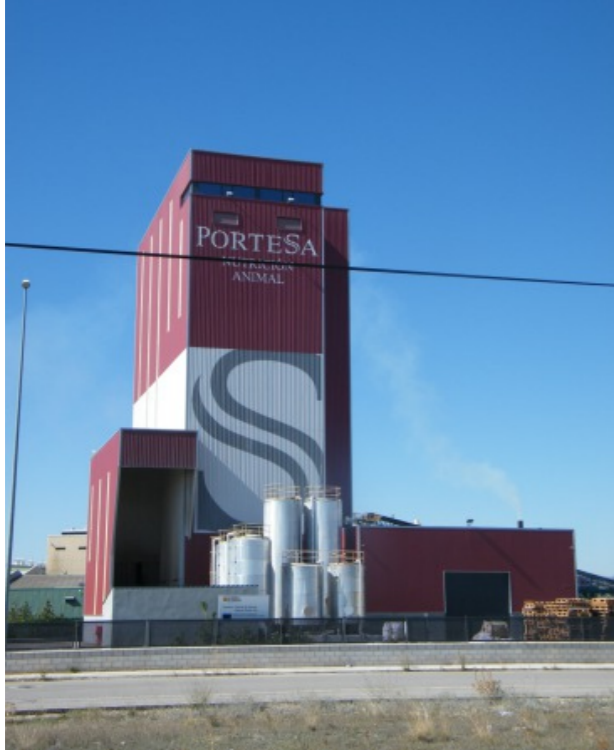
Fábrica de piensos de Portesa.

que si la tierra está prieta, protegerá a la semilla de las heladas.