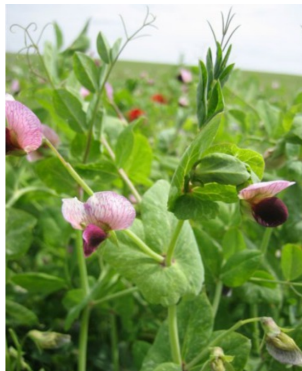
Flor del guisante.

La hoja estrecha es mucho más fácil de combatir, ya que el guisante es de hoja ancha, con lo cual, se puede aplicar en post-emergencia. Entre estos productos encontramos sustancias activas como el propaquizalop , de marca Agil, muy eficaz y con un precio de 30 euros por Ha. o el diclofop , de marca Claro, a 27,3 euros la Ha. Ambos son