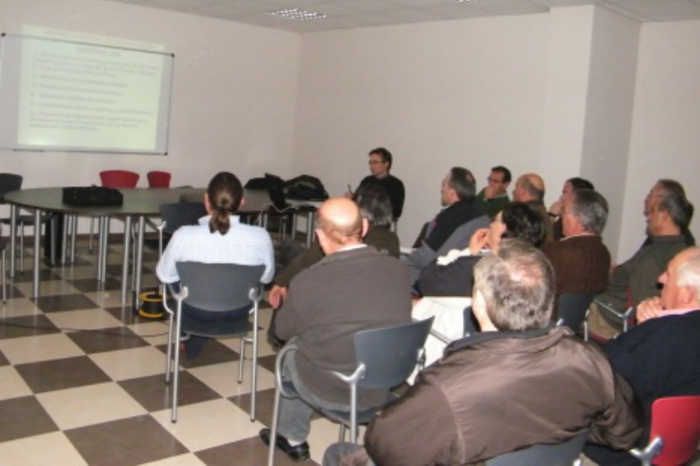
Asamblea de Calamocho.

tra cooperativa tiene un buen balance y que su situación financiera goza de buena salud.