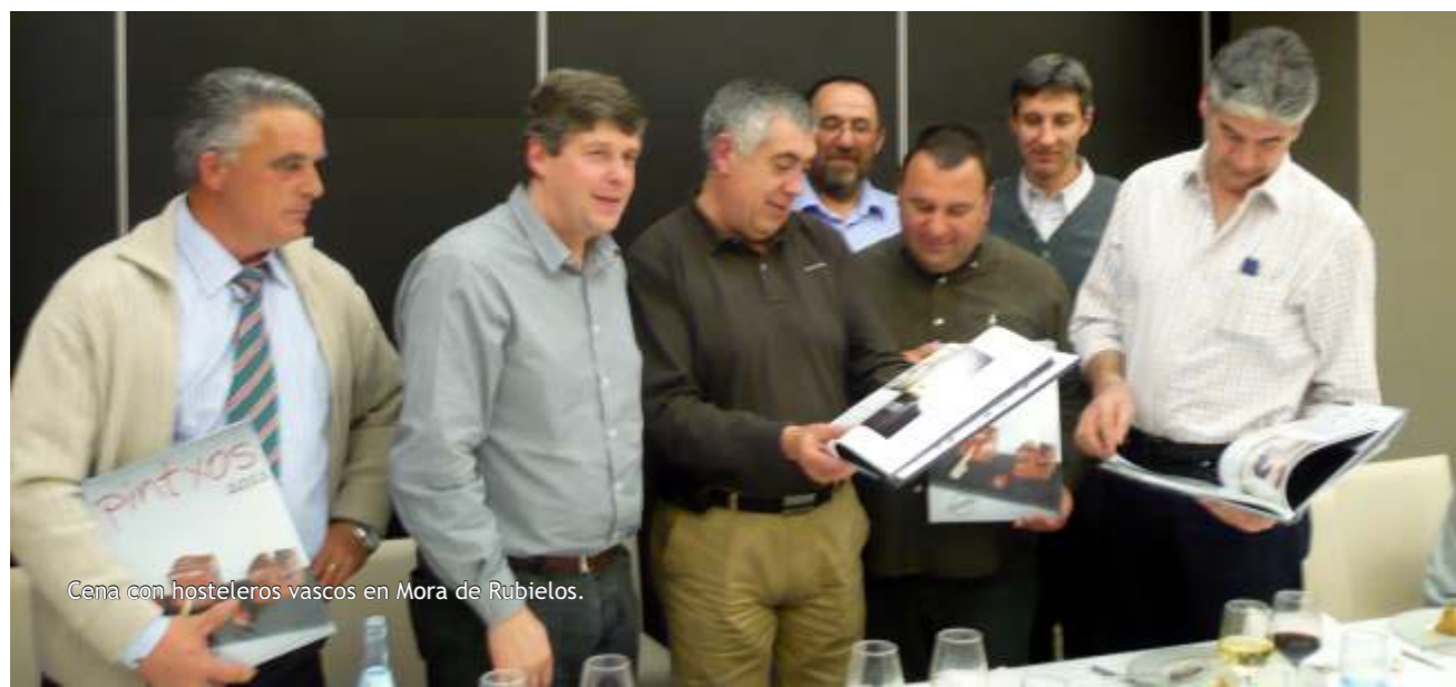
Cena con hosteleros vascos en Mora de Rubielos.

Por otra parte y dentro del Plan de Turismo Sostenible en la provincia de Teruel se celebró, en febrero, el II Foro del Turismo Turolense, donde se exploraron las nuevas tecnologías como un buen vehículo para la promoción turística, incluyendo el fomento de nuestra agroalimentación. El Patronato está preparando nuevas acciones en esta línea, entre las cuales destaca un plan de turismo agroalimentario, en el que están trabajando en la actualidad, y jornadas de formación destinadas a hosteleros y restauradores para sacar el máximo potencial a los alimentos de Teruel con calidad diferenciada. El objetivo de estas jornadas es que los restauradores turolenses conozcan los alimentos más destacados de nuestra gastronomía y los utilicen dentro de sus establecimientos como el auténtico reclamo turístico que son. Para ello, se plantea un programa de actividades en el que a través de la práctica, destacados profesionales del sector presentan los productos y cómo trabajar con ellos: habrá catas de Aceite de Oliva Virgen Extra del Bajo Aragón, técnicas de corte de Jamón de Teruel DO, maridaje de Quesos de Teruel con Pan de Cañada y Pintera (marcas C´ alial) y Vinos de la Tierra del Jiloca y del Bajo Aragón, recetas con Trufa Negra de Teruel, Azafrán del Jiloca, Ternasco de Aragón IGP y postre con Melocotón de Calanda y una charla titulada «Como hacer más atractivo mi establecimiento gracias a los productos de la provincia».