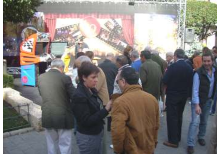
Acto promocional del Patronato en Albacete.

El Patronato de Turismo de Teruel no está ajeno a esta tendencia y es consciente de que la provincia de Teruel es rica en recursos agroalimentarios, no en vano, la industria agroalimentaria es uno de los pilares de la economía turolense y en nuestro territorio contamos con tres denominaciones de origen: Melocotón de Calanda, Jamón de Teruel, Aceite del Bajo Aragón; la Indicación Geográfica Protegida Ternasco de Aragón y otros alimentos de calidad diferenciada como la trufa negra, el azafrán del Jiloca, los panes, los quesos, las carnes de cerdo, la conserva, la repostería, los vinos de la tierra... por lo que muchas de las últimas acciones de promoción del Patronato de Turismo están encaminadas hacia el turismo agroalimentario.