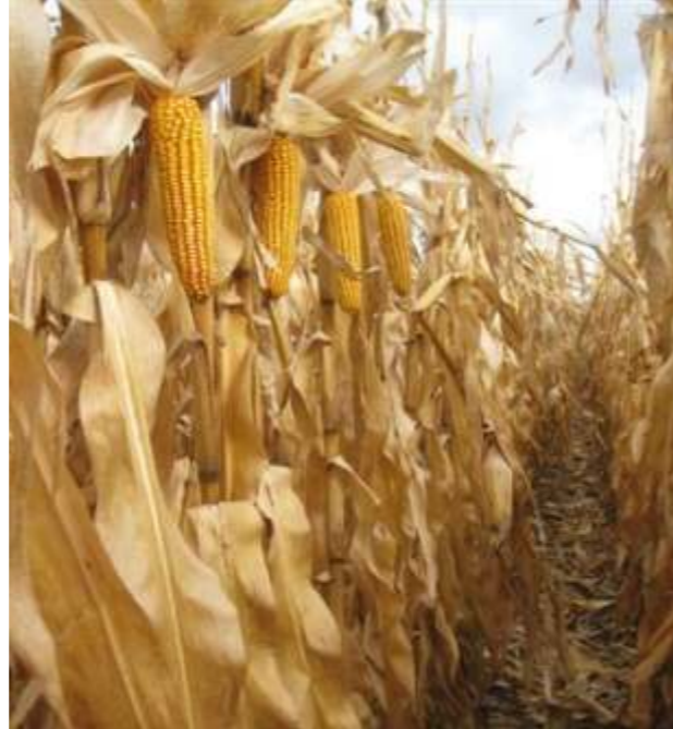
Maíz listo para cosechar.