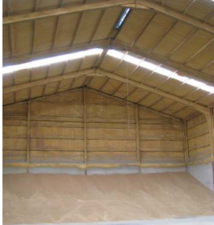
Almacén de Jarque de La Val.