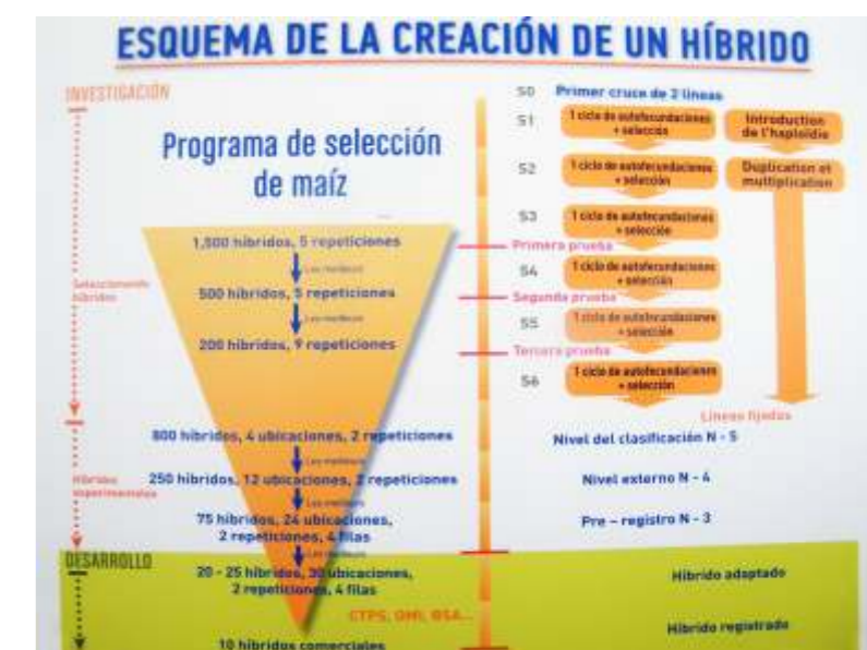
Panel informativo del grupo Maisadour.

El departamento técnico de la cooperativa lleva a cabo todos los años junto al Centro de Transferencia Agroalimentaria del Gobierno de Aragón los microensayos de variedades de maíz que pueden llegar a ser interesantes en nuestras zonas.