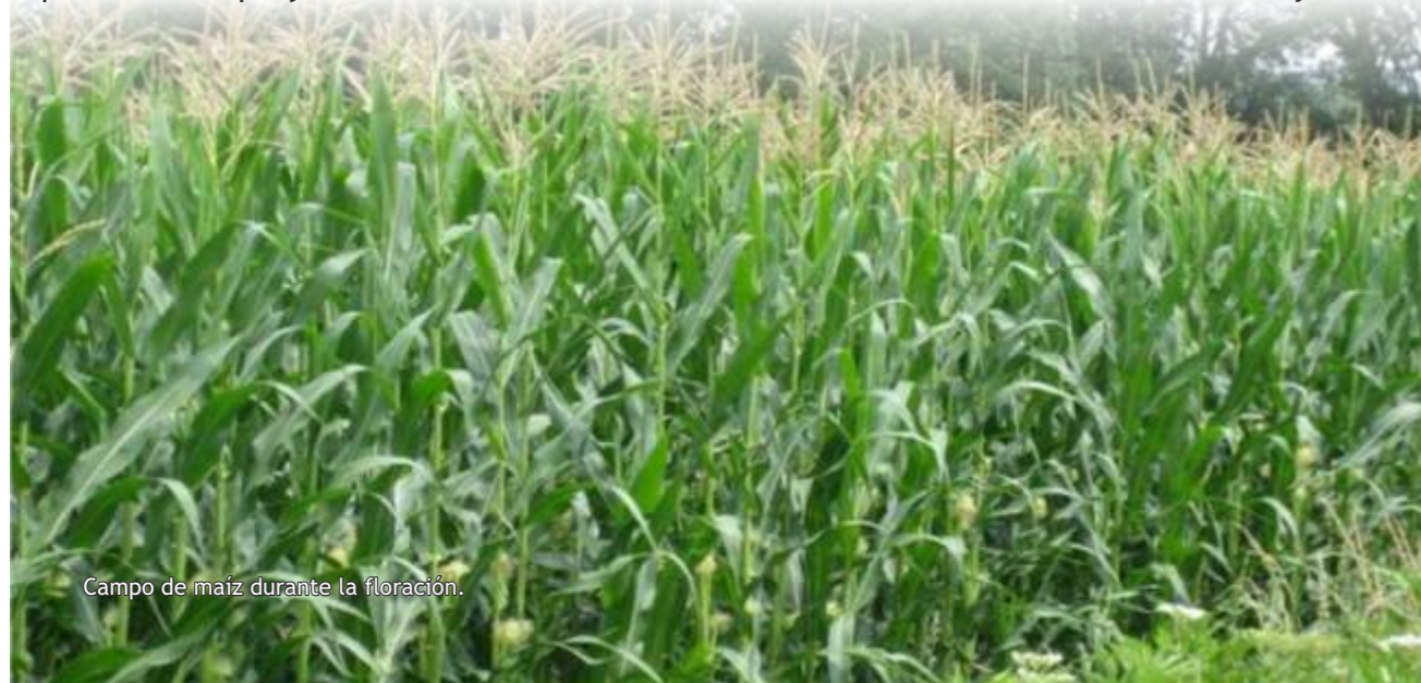
Campo de maíz durante la floración.

Existen tablas con las cuales podemos calcular la cantidad de plantas que ponemos por hectárea, calculando la distancia entre surcos y entre plantas (como la que mostramos a continuación). La densidad óptima está en torno a las 90.000 plantas/ Ha.